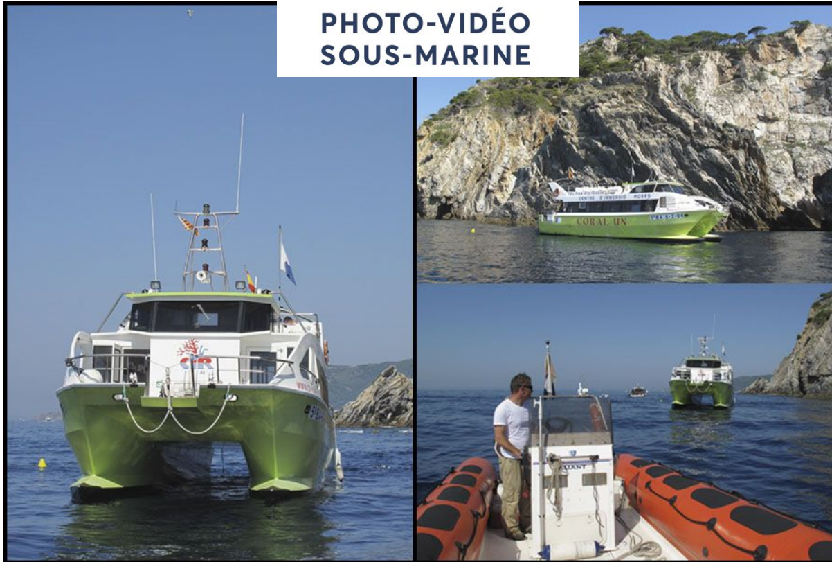
Figure 1: Le club de plongée : bateau spacieux "catamaran"

www.cir-roses.com – www.facebook.com/CIRRosés