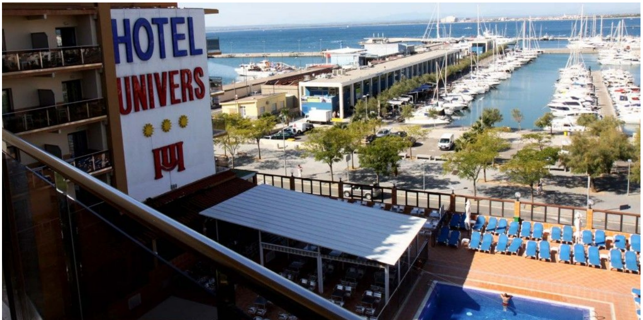
Figure 2: L'hôtel directement sur le port, accès direct au club de plongée à pied

www.cir-roses.com – www.facebook.com/CIRRosés